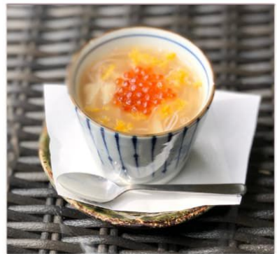
蓮根と焼もちのあんかけ