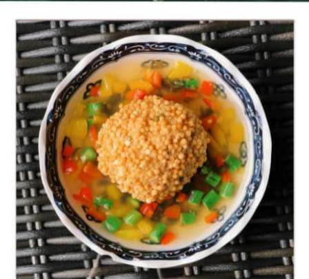
新じゃがまんじゅう