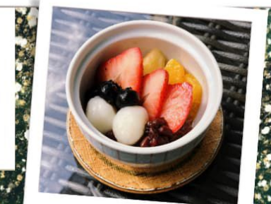
フルーツあんみつ

*前日までにご予約をお願いいたします。 *アレルギーをお持ちのお客様はご予約の際にお知らせ下さい。 *コースはディナーのみ、店内でのご飲食に限りのご提供となります。 *仕入れによっては内容が異なる場合がございます。 何卒ご理解をお願い致します。