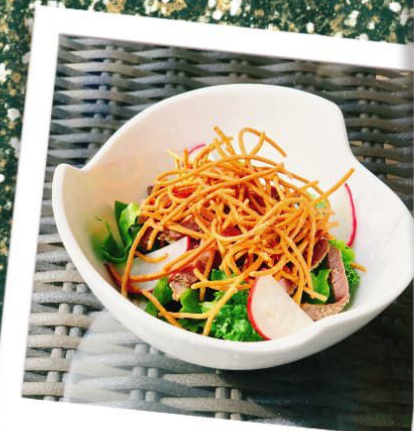
和牛炙りそばサラダ