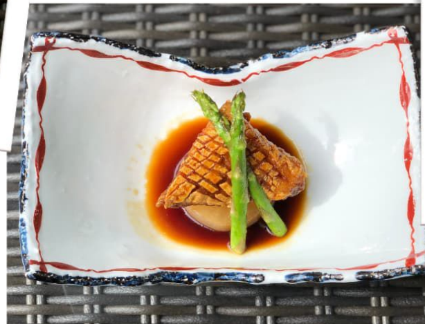
鰯かまのくわ焼き