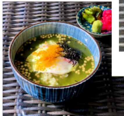
桜鯛のづけ茶漬け